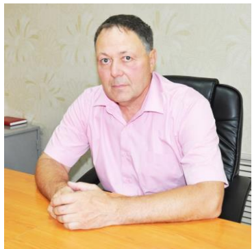
Председатель Совета ОО МННКА