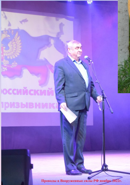
Проводы в Вооруженные силы РФ ноябрь 2022г.