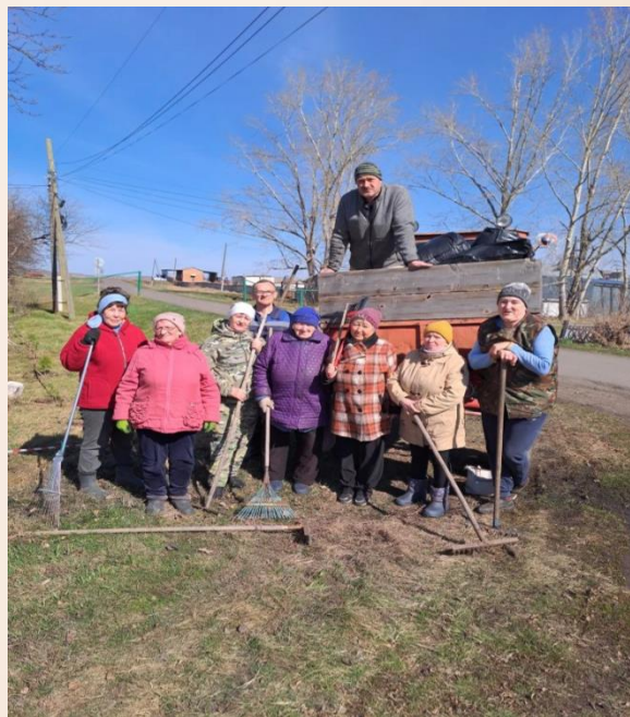
Субботник по благоустройству