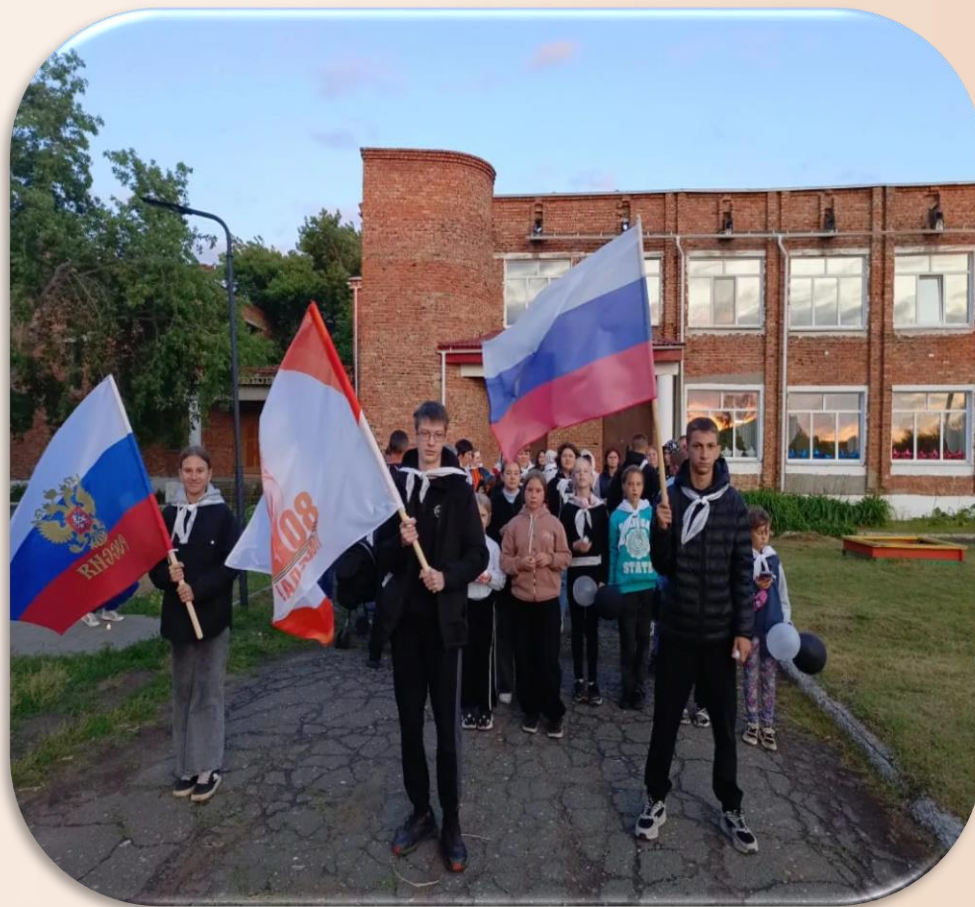
Вместе с молодым поколением 9 мая идем зажигать свечи памяти ВОВ