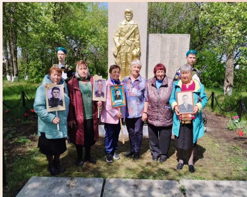
Дети войны у подножия обелиска.