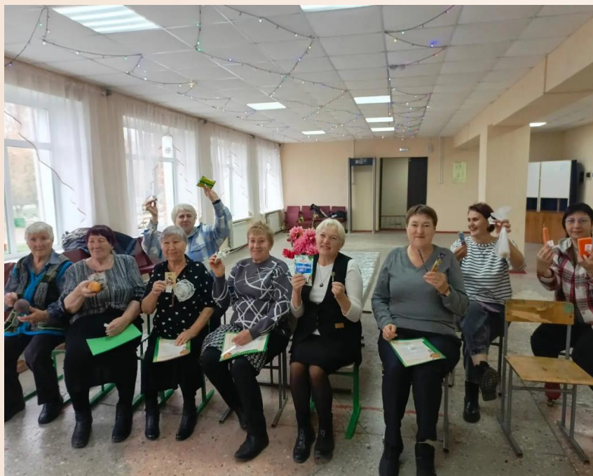
День пожилого человека проводим в СДК На почетном месте победители викторины.