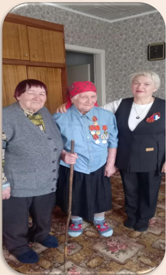
Чествуем Труженицу Тыла