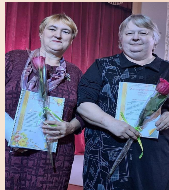
Наши Волонтеры СВО