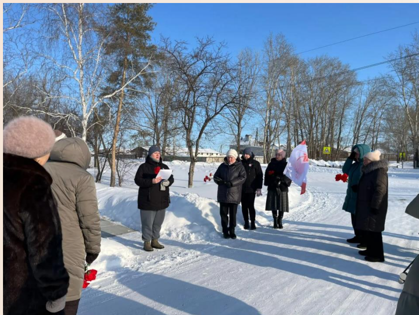
День Защитников Отечества