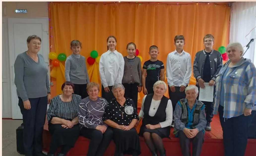
Нас поздравляют наши внуки