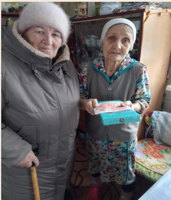
Поздравление Ветерана Труда

В течении года поздравляем юбиляров, с днем рождения старейших жителей села. Председатель Совета ветеранов присутствует на совещаниях, которые проводит Глава поселения. Ветераны всегда в курсе происходящего в поселении.