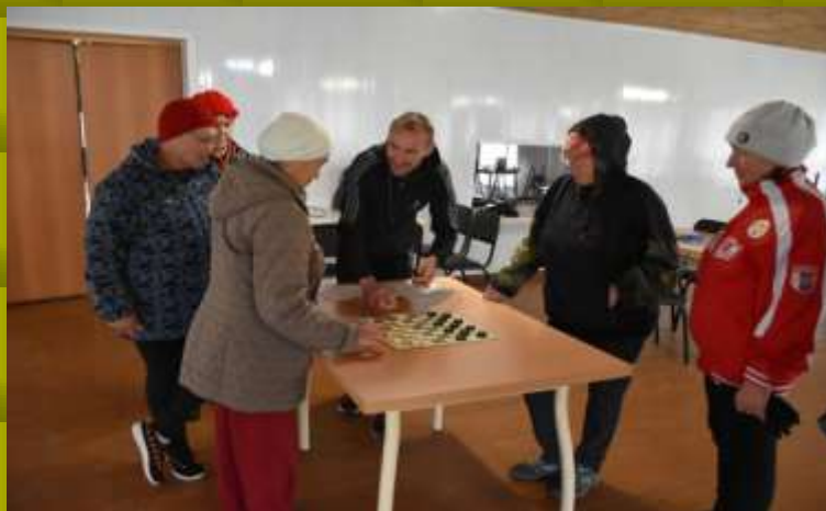
Любимые шашки Знаменское -1-- против Завьяловцев