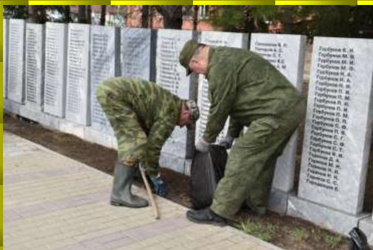
Приводим в порядок Мемориальный комплекс