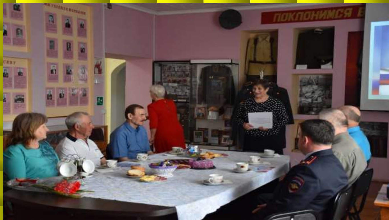
Встреча с ветеранами полиции в Знаменском музее