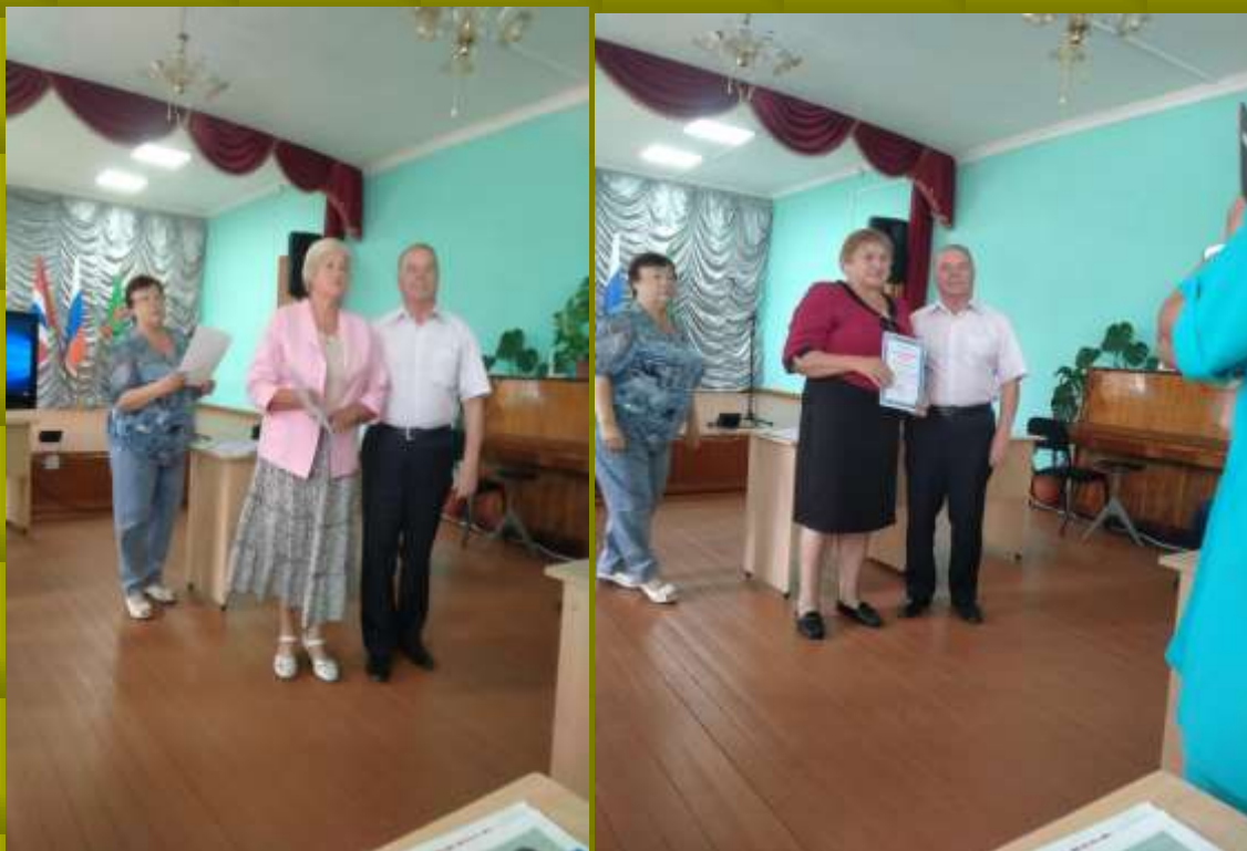
Получаем заслуженные награды

Большой праздник для пожилых людей- День пожилого человека прошёл в районном Доме культуры. Подготовлен концерт. За активную работу награждены ветераны, которые принимают активное участие во всех проводимых мероприятиях. Это костяк ветеранской организации. Они сами горят желанием и участием и привлекают других.