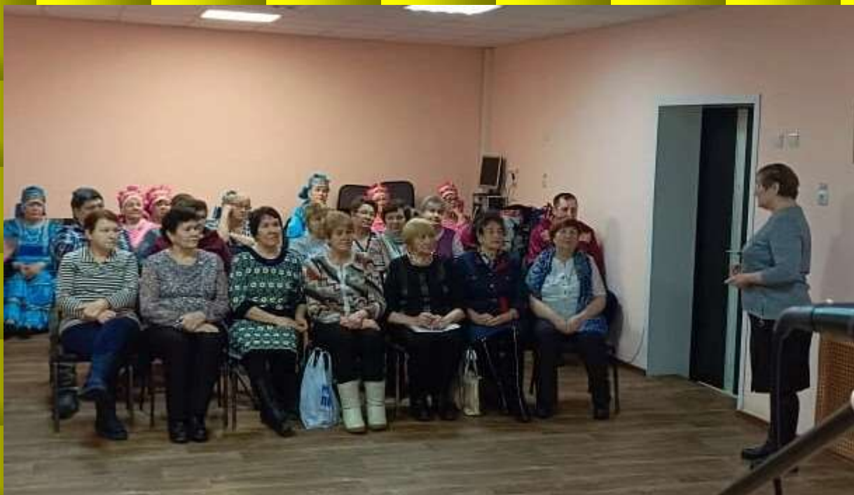
День пожилого человека в КЦСОН

В тесном контакте работаем с органами внутренних дел по Знаменскому району. Проводим встречи, награждения и поздравления с Днём полиции.