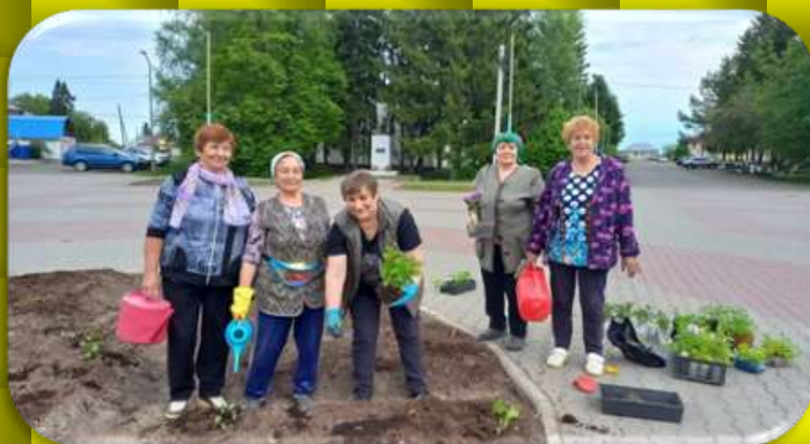
Дошло дело до рассады