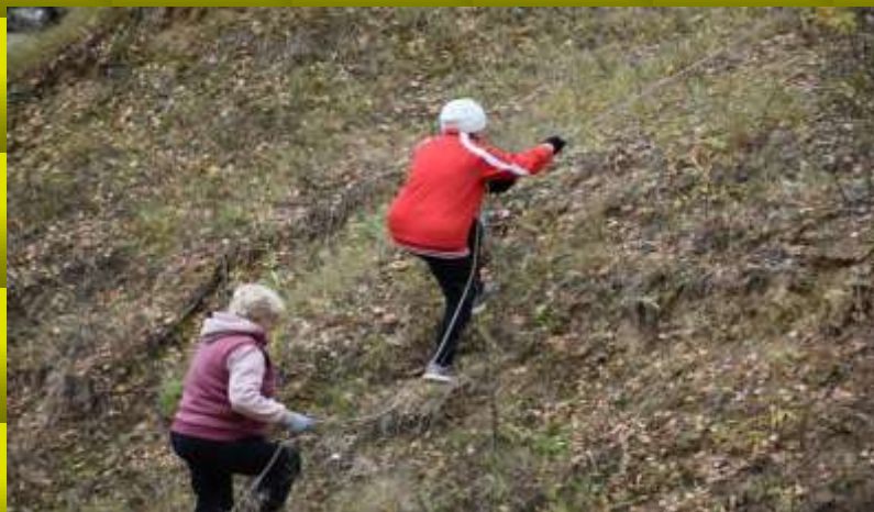
Команда Завьяловского поселения на подъёме в гору