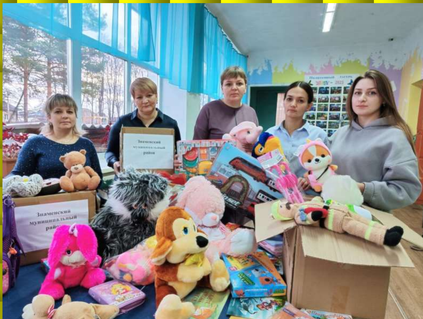
Игрушки для детей детского дома города Стаханова