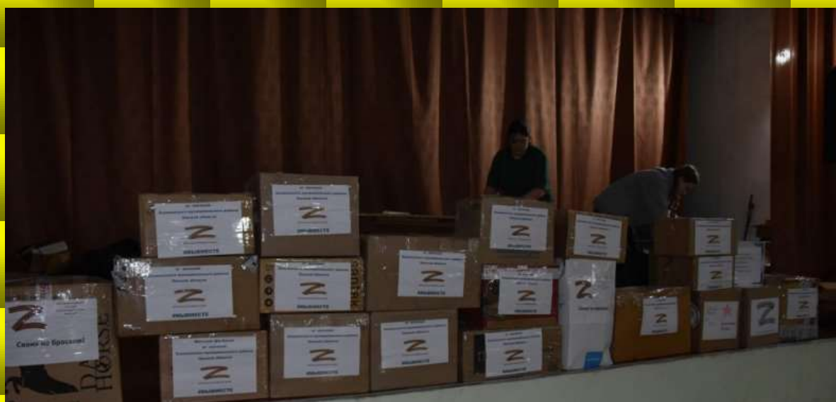
Гуманитарная помощь от знаменцев