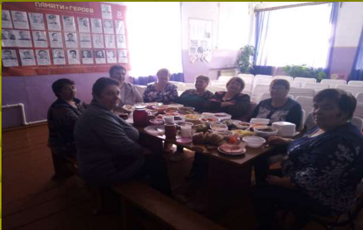
День пожилого человека в Новоягодном