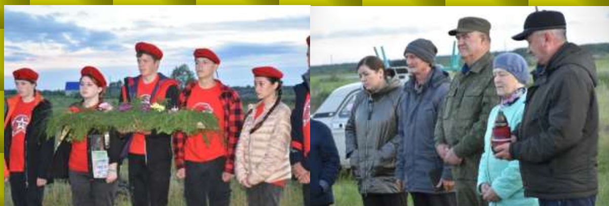
Отряд Юнармейцев БОУ"Бутаковская СОШ"Из воспоминания близких

Ежегодно районный Совет ветеранов(пенсионеров)организует в этот день выезд на берег Иртыша.Собирается около 40 человек, чтобы почтить память тех,кто с данного места отправлялся на пароходе на фронт. Разжигается костёр, звучит Гимн России, зажигается свеча Памяти и каждый присутствующий рассказывает о своём родственнике, который уходил на фронт. Юнармейцы выступают с военно-патриотической композицией. Спускается на воду венок из еловых веток со свечами. Метроном извещает стук сердца. Минута молчания. За трапезным столом боевые 50 грамм. Под баян исполняются песни участниками мероприятия. Очень волнительно, на глазах слёзы.