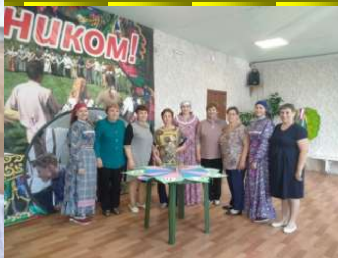
Финал Фото на память