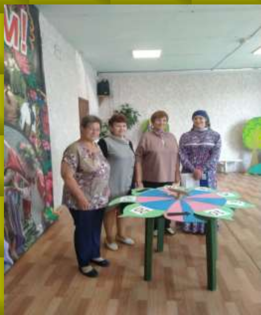
Третья тройка игроков

В Истоках прошло мероприятие, посвящённое Дню Матери. Была подготовлена программа "Поле чудес".