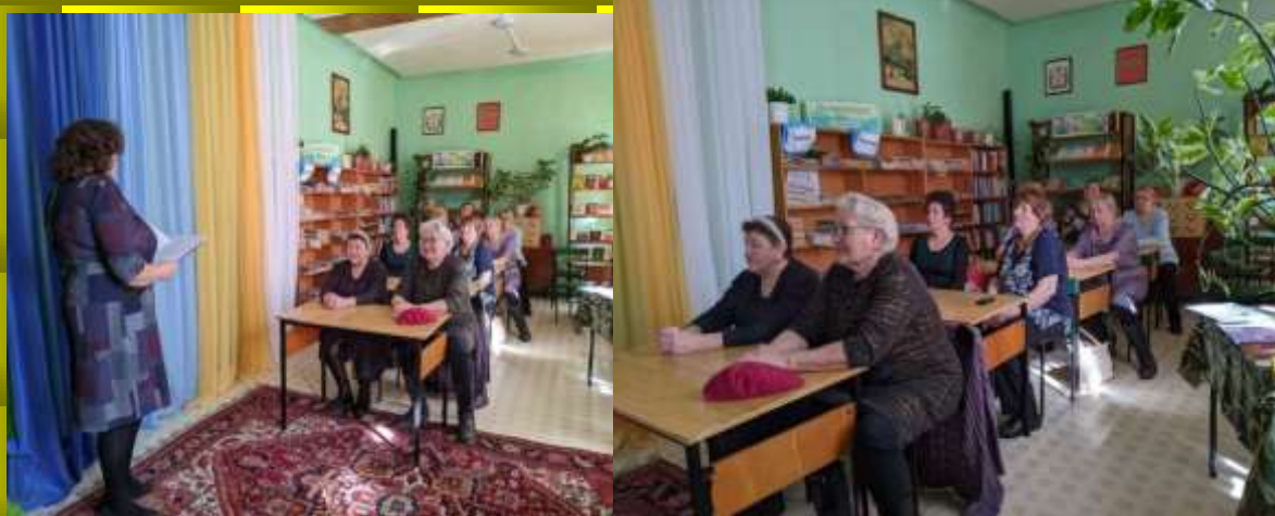
Час здоровья "Советы из лукошка"