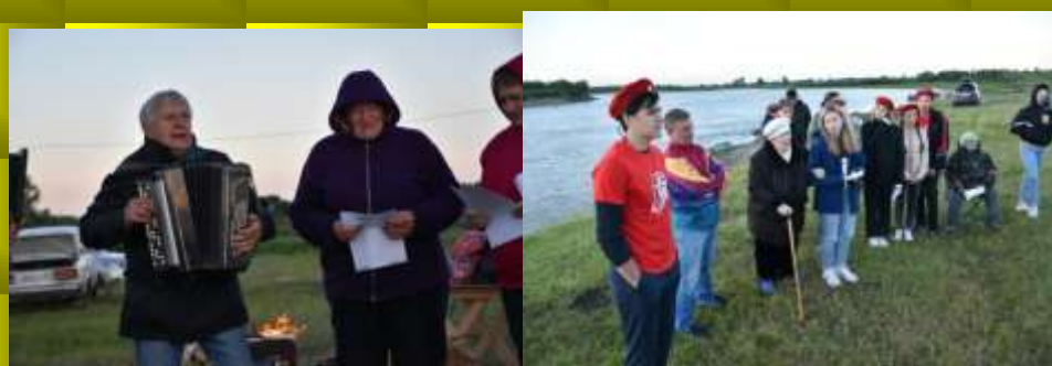
Песни под баян.