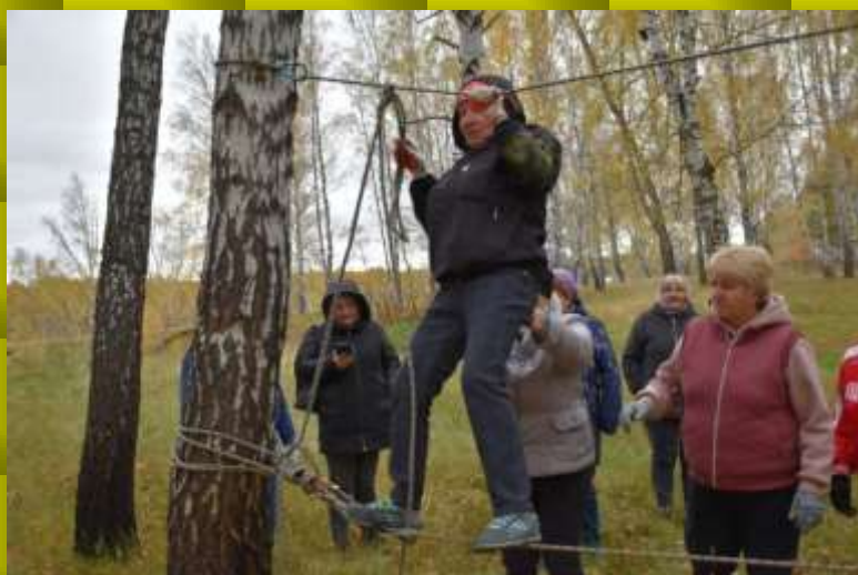
Сложное задание "Маятник"