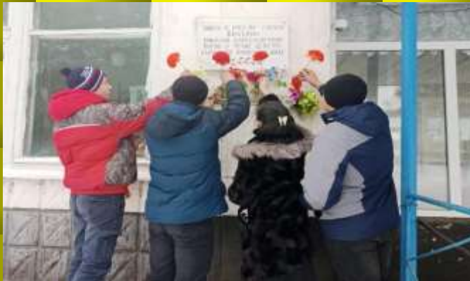
Возложение цветов у доски Ерахтина