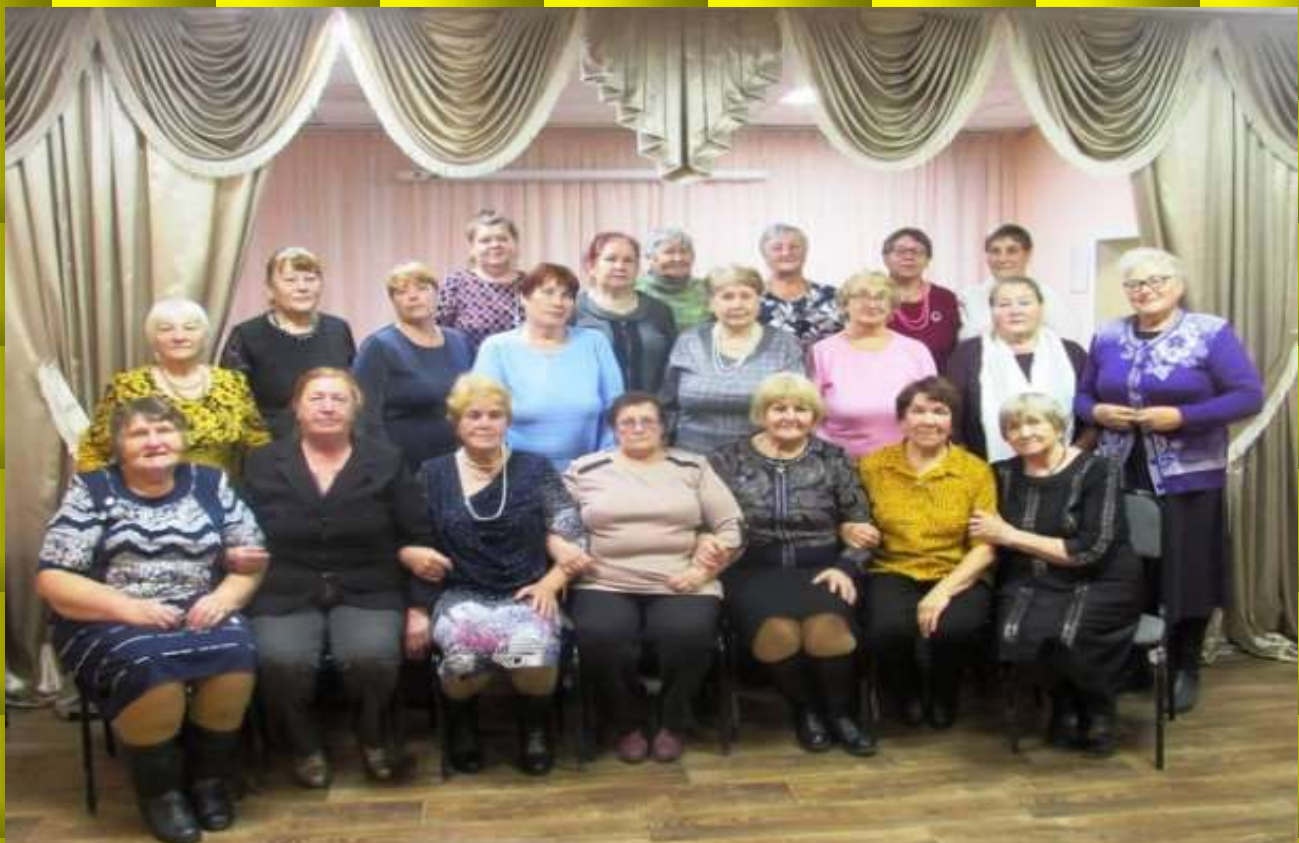
День пожилого человека в КЦСОН