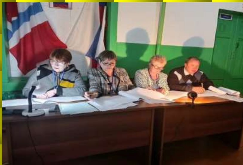
В день выборов

В 2023 году , в сентябре проходили выборы Губернатора Омской области. И опять мои активисты пенсионеры показали свою работу, любовь к избирателям, Родине. На их счету около тысячи избирателей у каждого. Сумели убедить каждого прийти на избирательный участок и проголосовать. Прodelана огромная работа.Каждый получил удовлетворение от своей работы. Пользуются почётом и уважением пенсионеры на селе. Своим примером показывают, что лучше России нет уголка на Земле.