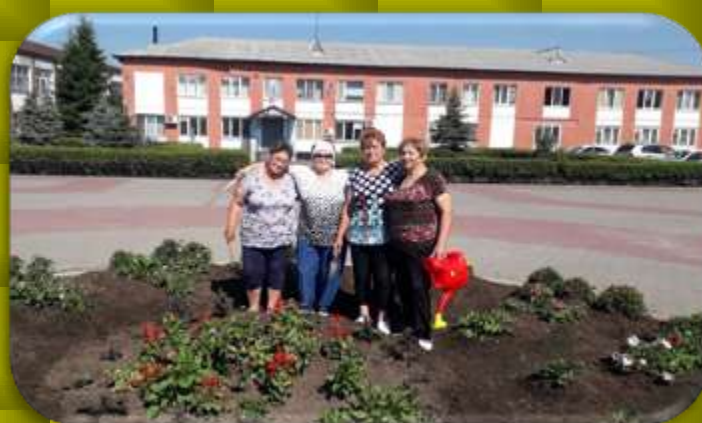
Полив и прополка цветочной клумбы