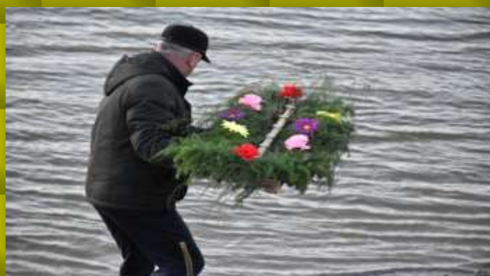
Спуск венка на воды Иртыша