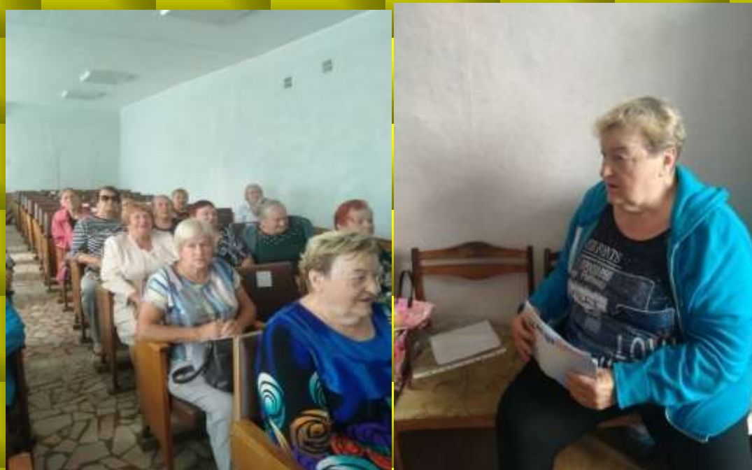
Работа пенсионеров - агитаторов