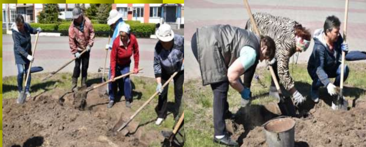
Дружно закипела работа

Не сидится пенсионерам без дела. На заседании Пленума единогласно решили взять шефство над озеленением одной большой цветочной клумбы на центральной площади села Знаменское. Работа закипела.