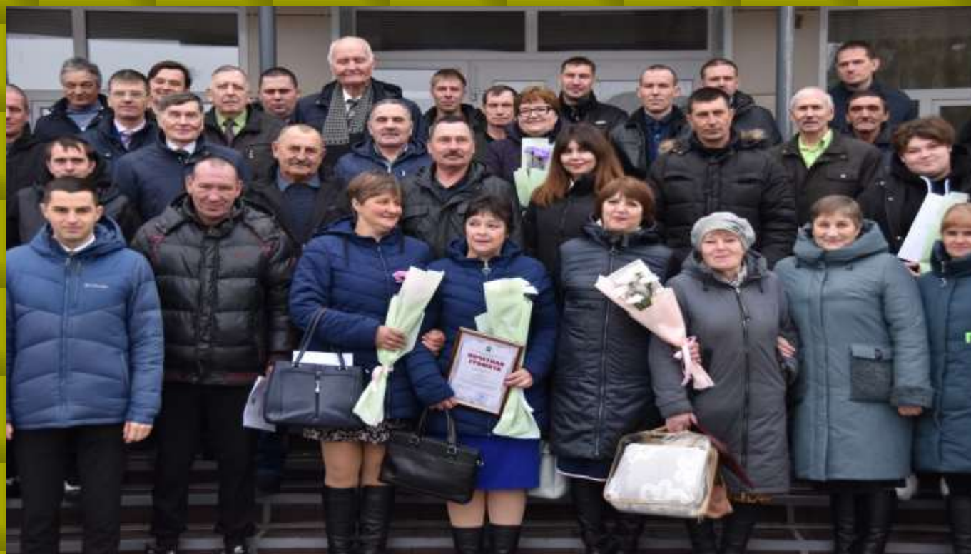
Дружный коллектив сельского хозяйства Знаменского района