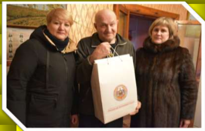
Поздравление с Днём Героя Отечества