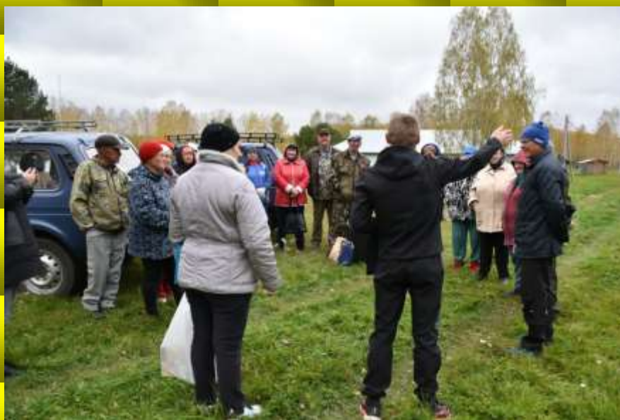
Построение и установка