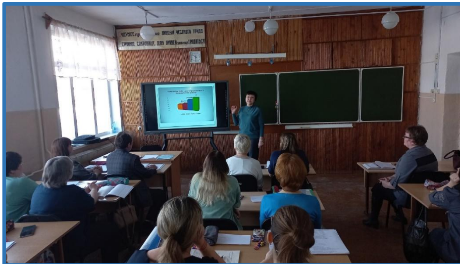
Встреча-семинар с представителями образовательных организаций района

В рамках реализации данных проектов специалистами ресурсного центра были проведены обучающие семинары для представителей НКО, общественности, инициативных граждан Исилькульского района. Сотрудники ресурсного центра рассказали об особенностях заполнения грантовых заявок.