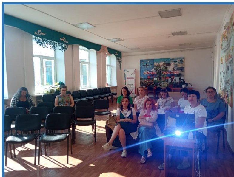
Переговорная онлайн-площадка по заявочной кампании «Росмолодёжь.Гранты»