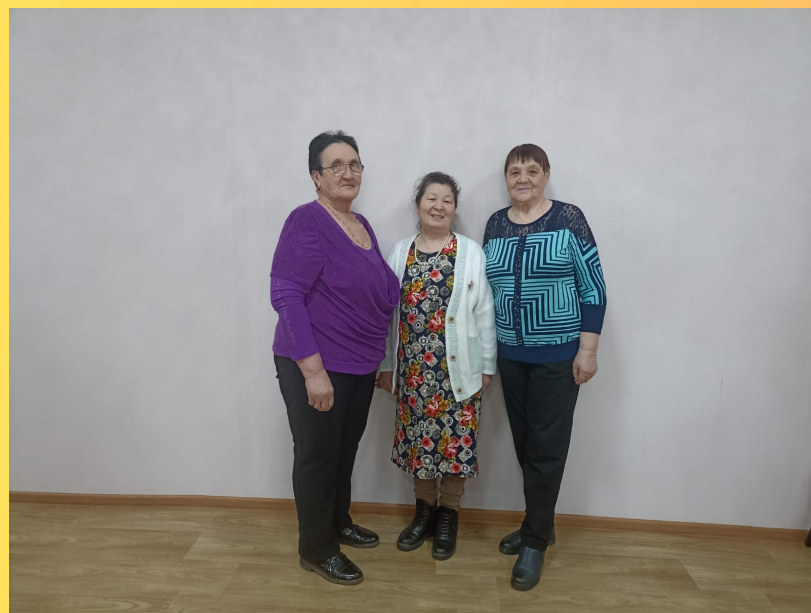
КРК КМО ВОИ