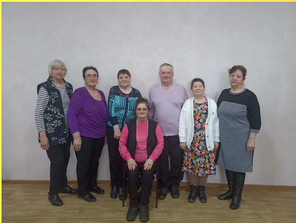
Президиум КМО ВОИ